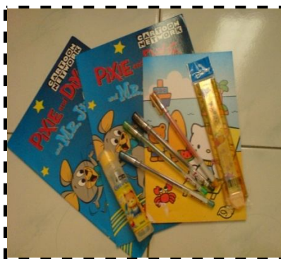
Rajah 1: Ganjaran dalam bentuk hadiah

Saya telah mengisytiharkan bahawa murid yang berkelakuan paling baik (tidak mengganggu rakan lain, menyiapkan kerja yang diberi, memberi tumpuan dalam kelas) dan mendapat markah yang baik dalam Ujian Diagnostik akan diberi hadiah. Rajah 1 menunjukkan ganjaran dalam bentuk hadiah yang pernah diberikan saya kepada murid-murid pemulihan dan Tomi.